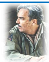
IL TENENTE CATELLI

➤ IL POSTER. Il manifesto del film sceglie come immagine chiave quella di Arturo in groppa ad un asino.